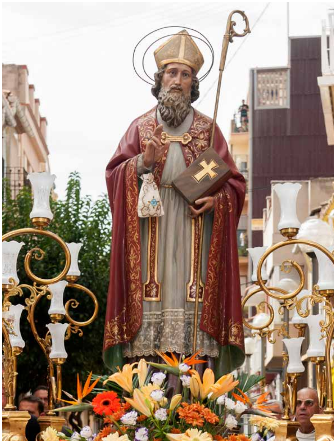
Santo Tomás de Villanueva